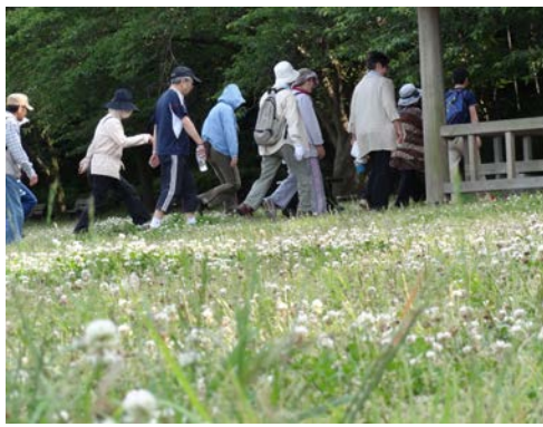
公開講座での運動教室の様子

262-8506 千葉市花見川区柏井町 800-1 電話：043-258-1211 FAX：043-258-1291 E-MAIL saisei@saisei.or.jp